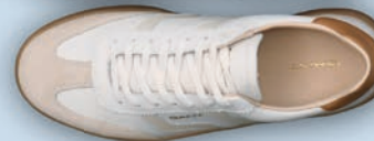
Sneaker Gant 139,95