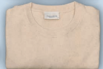
Halbarm-Pulli Profuomo je 89,95