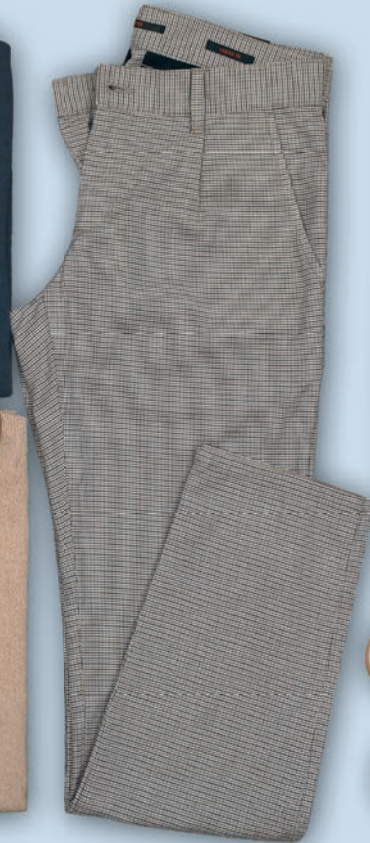
Chino Minidessin Alberto 99,95