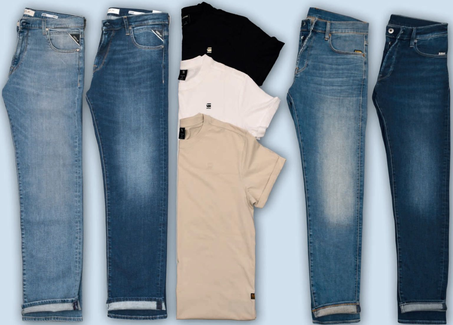
Jeans, etwas lässiger geschnitten, in light blue Replay 129,-