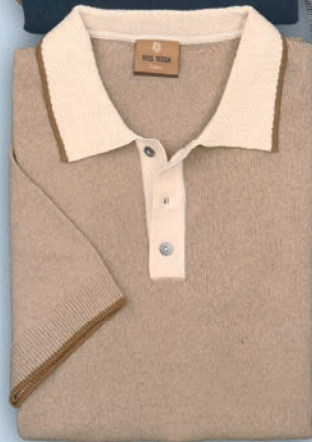
Strickpolo 1/2 Arm Mos Mosh je 99,99