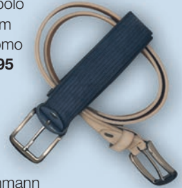
Gürtel Lindenmann je 49,99